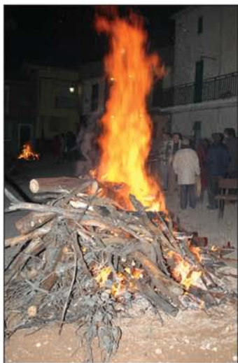
Iluminaria de la Purísima