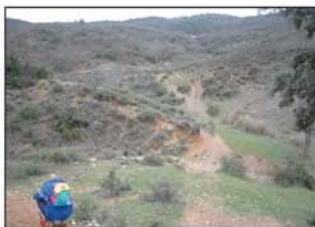
La senda cruza el cauce del barranco

por un camino que es prolongación de la misma, situada en el extremo NE del pueblo. Pasamos el puente (UTM=cruce01) por el que se cruza el arroyo de San Andrés. Continuamos unos 50 metros y de la curva del camino sale la senda (UTM=senda01) del barranco de la Casilla, que sigue en dirección SE ascendiendo y entrecruzándose con un itinerario para motos que lleva esta dirección.