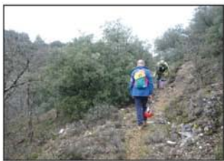
Ascendemos por un senda

parajes de todo su término municipal: el valle del corto arroyo de San Andrés, con sus sombreadas choperas, multitud de nogales y los arroyos y barrancos que descienden de sus mesetas alcarreñas entremezclados con bosques de pinos y encinas que son recorridos por sendas que nos deleitarán con sus inesperadas vistas sobre el valle.