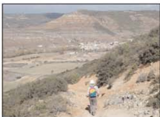
Descendemos a Romanones

La senda llega a Tendilla (UTM=tendilla) a los 6 km.; tras recorrer el pueblo, visitar su iglesia y comer en cualquiera de sus establecimientos. La vuelta a Romanones parte desde el mismo lugar por el que hemos entrado en Tendilla, pero enseguida abandonaremos el "Camino de Romanones" para seguir a