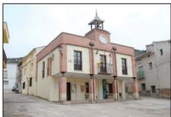
Fachada del ayuntamiento

El palacio de los condes de Romanones es, quizás lo más