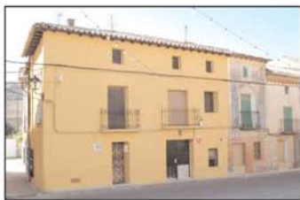
Vista del pueblo

destacable en el terreno arquitectónico; y un caserón cercano al palacio, de aspecto sorprendente, pintado todo él de azul, ambos en el extremo NO del pueblo. En el otro extremo se asienta la iglesia sobre una terraza con imponente fábrica renacentista, en la que alberga una interesante pila bautismal y varias tallas de los siglos XVI y XVII.