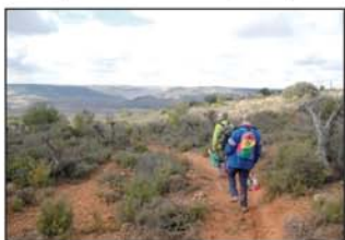
Transitamos por cómodas sendas

Saldremos de Romanones desde la plaza (UTM=salida) para seguir por la calle principal que atraviesa el pueblo hasta llegar al cruce de la calle La Presa (UTM=calle01) donde giraremos a la derecha y seguiremos por esta calle y después