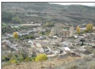
Vista de Tendilla

unos 100 metros más allá, en una curva muy cerrada en la que hay una gran carrasca, la pista gira al O, pero nosotros continuaremos al SE por una senda antigua (UTM=senda02) que va por el borde de un terraplén. Esta senda los de Tendilla la llaman el Camino de Romanones.