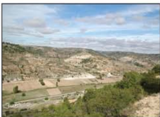
Vista del valle del Arlés

mejor antes de descender, deberemos ir atentos a las vistas que se ofrecen, ya que desde aquí conseguiremos las mejores fotos del valle del Arlés y de Alhóndiga, ya que el pueblo se nos muestra en sucesivos aspectos antes de llegar a la carretera, cerca de un puente.