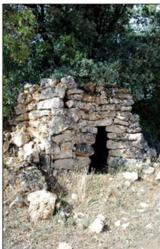
Chozo de pastores

Continuamos nuestra ruta ascendiendo el barranco para salir del camino por otro que nos sale como medio km más allá de la ermita, a la izquierda (UTM=giro02), al cumplirse los 6 km desde la salida.