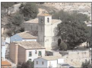
Vista de Alhóndiga

Una vez en Alhóndiga podemos enlazar con la ruta SL-5 a Fuentelencina o también con la ruta SL-8 hacia Auñón, bien continuando por el valle del Arlés pasando por la ermita de la Virgen del Collado, o bien por un viejo camino medieval que nos llevará hasta Auñón.