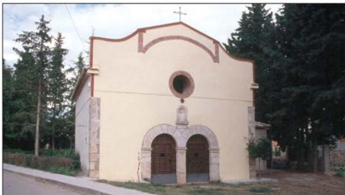
Ermita de San Roque

Fiestas populares y romería a la Virgen del Saz (8 de septiembre).