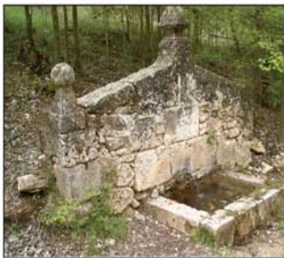
Fuente en la ermita del Saz

está la ermita y un amplio refugio. Este es uno de los pocos lugares de romería todavía activo y que reúne cada año, para el 8 de septiembre, a un numeroso gentío de varios pueblos de la comarca para rendir devoción a la Virgen del Saz, que se muestra sobre un tronco de sauce, bajo el cual brota un manantial que luego sale al exterior.