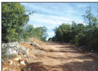
El camino transita por un buen carril

Nuestro nuevo camino (del Morago), gira para seguir una dirección N, hacia Alhóndiga, cruzando una meseta sembrada de cereal. Dejamos un camino a la derecha (UTM=cruce03) y llegamos a los 7,5 km a una bifurcación, (UTM=cruce04) en el que seguimos a la izquierda.