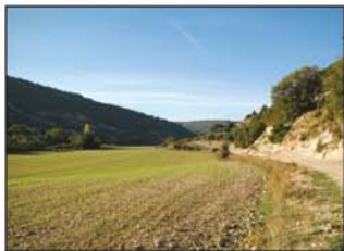
Valle del Arlés

2007 (UTM=cm2007), que la seguiremos unos 200 metros a la derecha, en dirección a la localidad de Valdeconcha, hasta que encontremos un camino que sale a nuestra izquierda (UTM=pista01). (Hay un cartel indicador a la ermita de la Virgen del Saz).