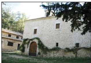
Ermita de la Virgen del Saz