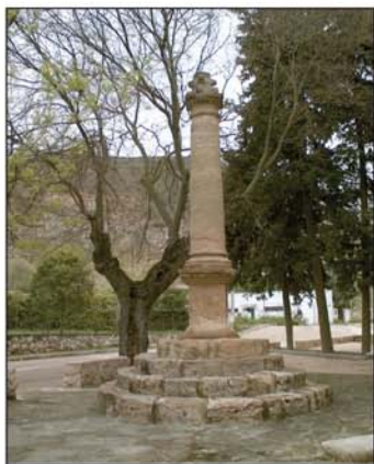
Picota de Alhndiga

Nuestra ruta, SL-6 (Sendero Local), est sealizada con