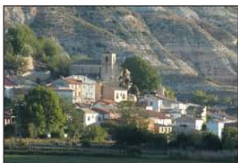
Vista de Alhndiga

A los 2 km se nos queda a la izquierda los restos del molino de la Dehesilla, dejamos el camino del molino del Trago (UTM=giro01) y cruzamos el ro Arls por un puente para incorporarnos a la carretera CM-