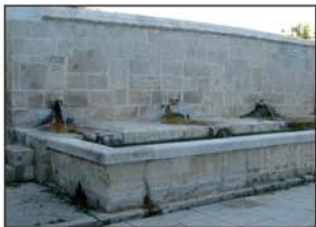
Fuente de Abajo

materia de fuentes hemos visto en esta provincia.