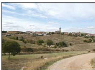
Camino de regreso a Fuentelencina

Continuamos llevando el Arlés a la derecha y a los 10,5 km. llegamos a Alhóndiga. Para regresar, desandamos el medio km que nos separa del barranco de la Calleja, ahora a nuestra dere-