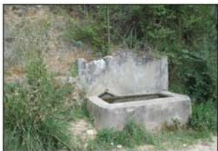
Fuente de los Perros

El camino va cerca del arroyo y de las antiguas huertas, casi todas abandonadas pero entre un paisaje de espesura vegetal que oculta las ruinas de algún antiguo