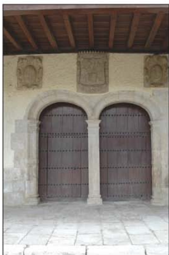
Portón de entrada al ayuntamiento

La iglesia parroquial dedicada a la Asunción está escoltada por imponente torre y en su interior alberga un retablo de Francisco Giralte, bellissimo y