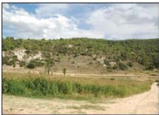
Por el Valle del Arlés

molino y el caz que le daba vida y a menos de un kilómetro del cruce anterior dejamos otro carril a la izquierda (UTM=cruce02).