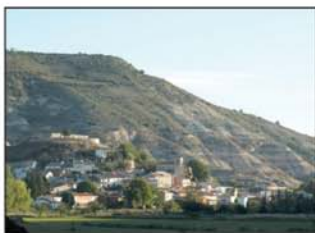
Vista de Alhóndiga desde el valle

pista acaba ante una valla de alambre que corta el antiguo paso al molino. Cruzamos el barbecho y nos situamos en el carril que une el molino con la carretera CM-2007. En este lugar se rodó algún capítulo de la serie "Curro Jiménez", el viejo molino se transformó para la ocasión en una fonda.