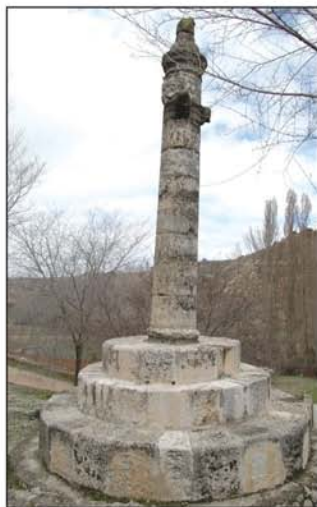
Picota de Peñalver

Las laderas del valle están cubiertas de espeso bosque y a los 7,5 km desde el inicio, llegamos de nuevo a Peñalver por la picota (UTM=picota). Desde la picota sale un camino que cruza el arroyo por un puente muy fotogénico, casi cubierto de hiedra; seguimos hacia el O, para visitar la fuente de la Pecedora, recientemente recuperada y embellecida por los propios vecinos. Regresamos por el mismo camino deteniéndonos en la fuente de Benito y en la de La Canaleja, que está clausurada, entrando de nuevo en Peñalver, terminando esta ruta de 10 km.