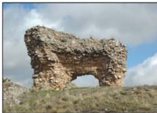
Resto del castillo peñamelero

Seguiremos hasta un cruce (UTM=giro01), para girar a derecha y poco después pasar junto a una nave agrícola (UTM=nave). En un cruce (UTM=giro02) seguimos a la derecha; a 200 m está la ermita del Cristo de la Paz (UTM=ermita), que no dejaremos de visitar; retornaremos de nuevo nuestros pasos hasta el cruce en el que nos encontramos y en el que la pista enfila al O; es el camino del Vallejo, paraje que nos proponemos visitar. El camino discurre al principio entre barbechos, y visitamos un cercano chozo de piedras, refugio de pastores y labradores en días de tormenta. Dejamos un carril (UTM=cruce) que nos sale a la derecha para comenzar a descender el vallejo