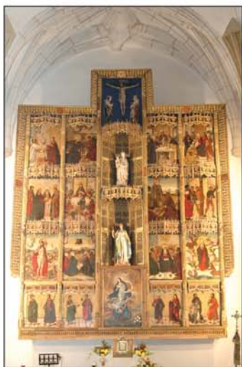
Retablo de la iglesia

Está situado en la cabecera del río Prá, que por aquí se llama Arroyo de la Vega. El pueblo no es visible hasta que estamos a poca distancia de él, tras un recodo de la carretera, aparece de pronto cubriendo la ladera del cerro en el que se asienta, que forma un circo sobre el valle. Poco antes de llegar a las primeras casas del pueblo, un hermoso mirador nos deleitará