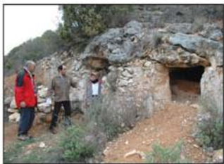
Visitando la Cueva de los Hermanicos

yo, a nuestra izquierda, a 200 metros, debajo de un nogal. Retornamos de nuevo al camino y 100 metros más adelante llegamos a un cercado de recia pared de piedra; se trata del huerto de los Hermanicos, entre tobas y cuevas el arroyo se despeña por un pequeño barranco.