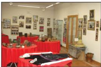
Museo de la Miel