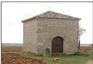
Ermita del Canto Cristo

Iniciamos el itinerario desde la plaza (UTM=salida), saliendo del pueblo por el NO, ascendiendo por el camino del cementerio (UTM=cement), que enseguida gira al S, y ofrece extensas vistas sobre el pueblo, la Vega, y las bodegas.