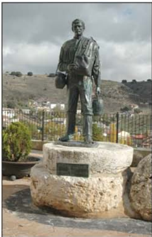
Monumento al melero

En su caserío abundan las casas típicas de la Alcarria, con casonas de más empaque, como la Casa del Patio o la de la Posada y entre sus calles o en su término es fácil encontrar alguna fuente; un vecino ha elaborado una lista de cuarenta, todas con su nombre.