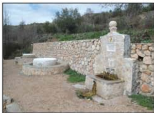
Fuente de la Pecedora

Descendemos de la cueva y retomamos el camino que desciende al lado del arroyo. Pasamos bajo un dosel de bosque mixto y llegamos al arroyo de la Vega, lo ascendemos hacia el N por un camino (UTM=giro03) que viene de Tendilla, llevando el arroyo a la izquierda. Continuamos por la pista que va por la umbría.