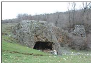
Huerto de los Hermanicos

A los 900 m de tomar el carril, llegamos al arroyo del Vallejo, también llamado de los Cubos. Dejamos momentáneamente el camino para visitar el nacimiento del arro-