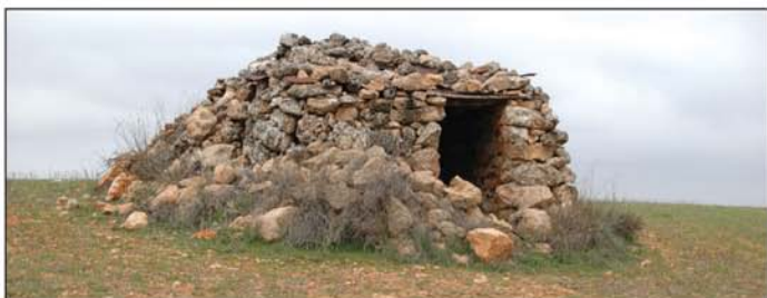
Chozo de pastores