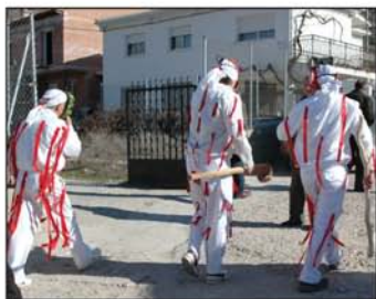
Botargas de San Blas