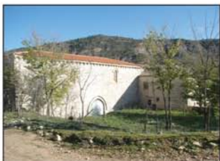
Ermita de la Virgen del Collado

Continuamos hacia el E, cruzando el río por un puente (UTM=via01) y dejando a la izquierda el túnel por el que permite el acceso a Berninches. Nosotros saldremos del asfalto por un camino