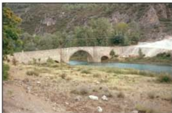
Puente medieval sobre el Tajo

Partiremos desde la plaza en donde se encuentra el ayuntamiento (UTM=salida) y recorriendo la calle Mayor, ascenderemos hasta la antigua carretera nacional, la N-320a; la calle en su último tramo se llama, de Francisco Tomey y es donde están las piscinas.