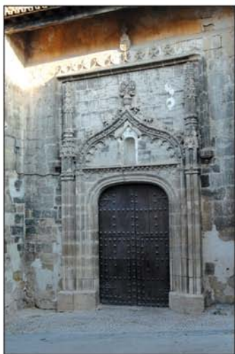
Portada de la iglesia

Un recorrido por sus calles tiene numerosos atractivos, dado que aún conserva algunas casonas medievales, pasadizos, callejas y miradores llenos de tipismo que nos muestran auténticas postales muy pintorescas.