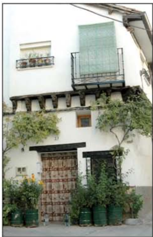
Bello rincón del caserío

El Camino de las Cuestas comienza donde termina esta calle, y durante todo su recorrido está jalonado con marcas blancas y verdes, es el SL-8 (Sendero Local).