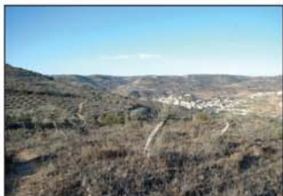
Vista de Alhóndiga

En la vega del mencionado río, encajonado entre imponentes cerros que lo rodean, Alhóndiga merece una detenida visita que completará esta ruta.