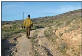
La ruta transita por una buena pista

Cuando llevamos 1,5 km andando, llegamos a un collado en la loma del cerro,