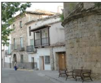
Vista del pueblo

La impresionante iglesia parroquial, dedicada a San Juan Bautista, es su monumento más destacable con un bello retablo en su interior; también debemos visitar la capilla-museo del obispo de Salona, situado en una recoleta placita.